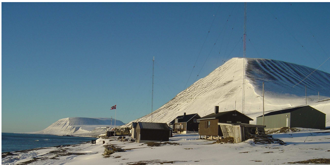
Foto: Thomas Olsen, Vervarslinga for Nord-Norge Hopen meteorologiske stasjon, september 2005.